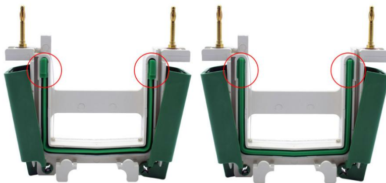
图2. 碧云天、Bio-Rad等公司的电泳槽U型硅橡胶密封条的突起结构图。由于碧云天的BeyoGel™ Elite PAGE预制胶的该部位是平的,使其兼容几乎所有厂家的小型胶电泳槽,所以电泳时须将具有突起结构的硅橡胶密封条(左图)取出后反过来安装(右图),使其没有突起的平滑面朝外,从而防止漏液。